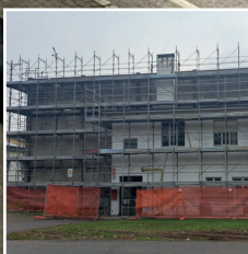
I lavori al Palazzetto dello Sport