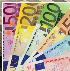
I nuovi finanziamenti pubblici