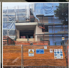
La scuola primaria di Villongo