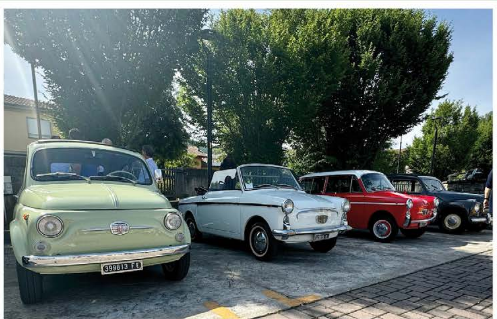
RADUNO AUTO D'EPOCA