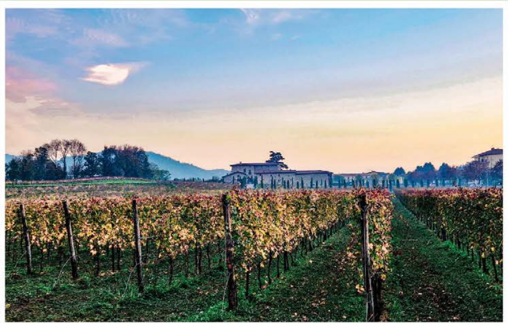
AUTUNNO A VILLONGO