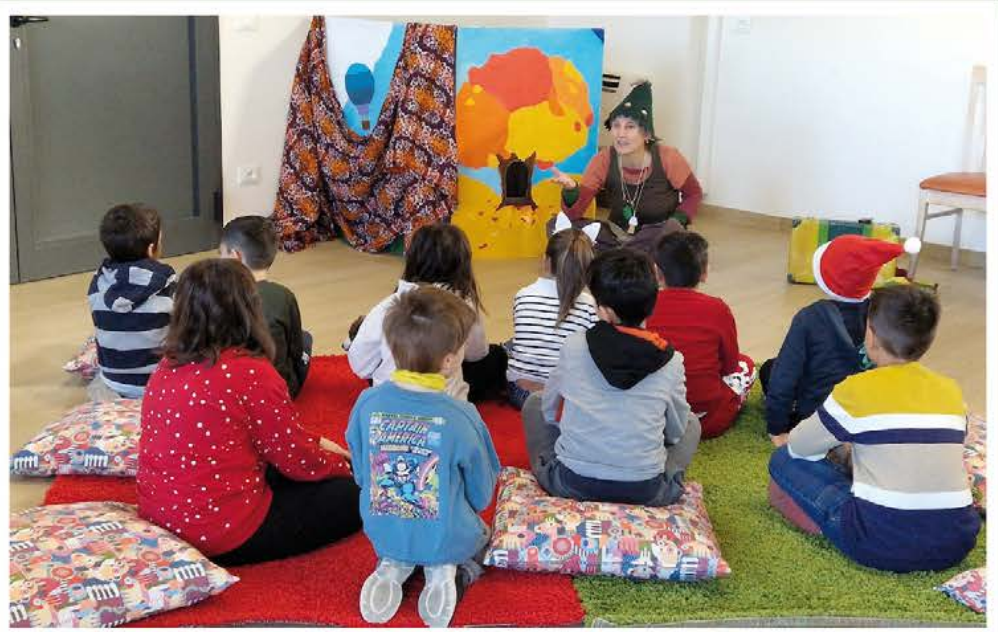
LABORATORI E LETTURE ANIMATE PER BAMBINI