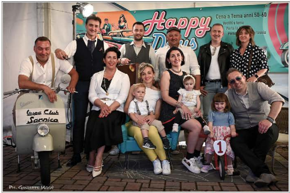
FESTA ANNI '50