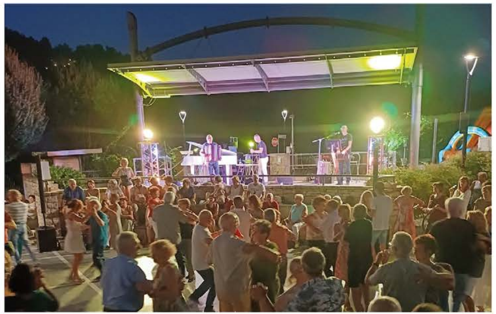
BALLANDO IN PIAZZA