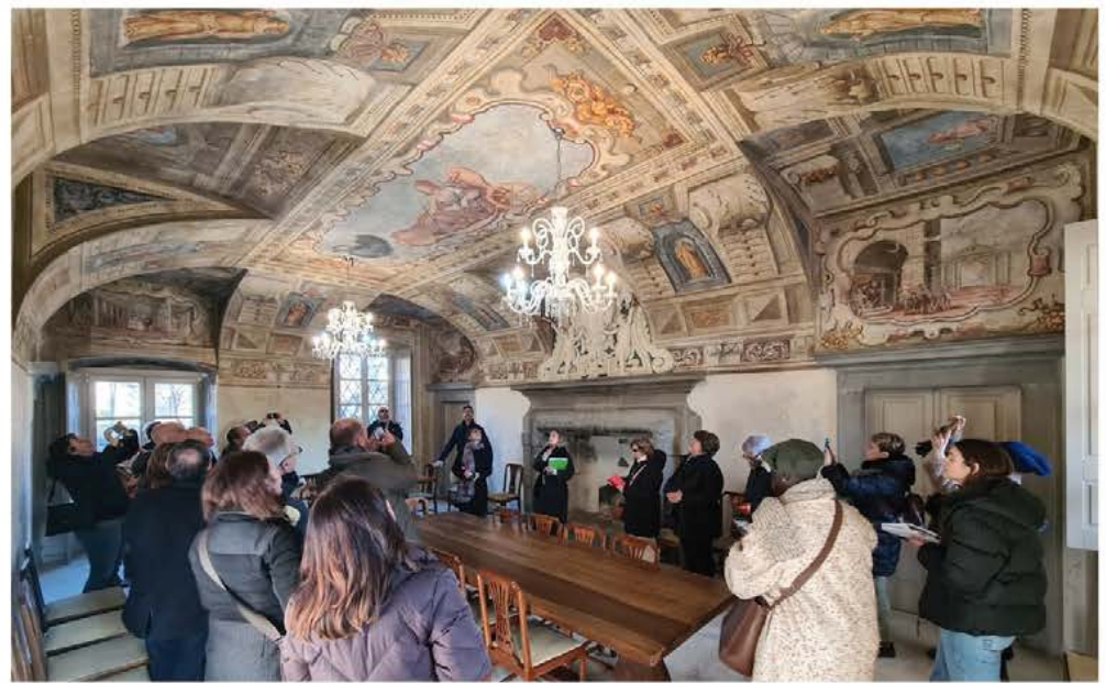
GIORNATA DEL FAI: ALLA SCOPERTA DELLE BELLEZZE DI VILLONGO