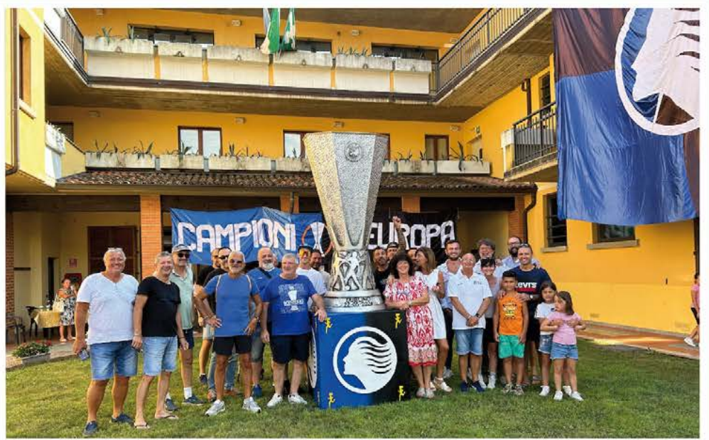
FESTEGGIAMENTI COPPA EUROPA LEAGUE