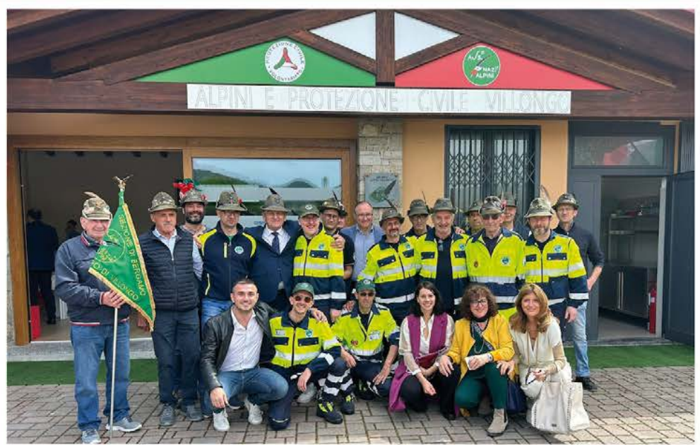
INAUGURAZIONE NUOVA SEDE ALPINI E PROTEZIONE CIVILE