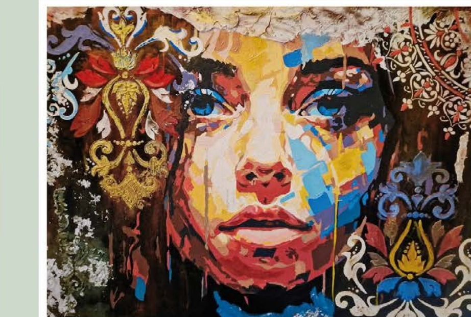
MOSTRA IN OCCASIONE DELLA GIORNATA PER L'ELIMINAZIONE DELLE VIOLENZE CONTRO LE DONNE