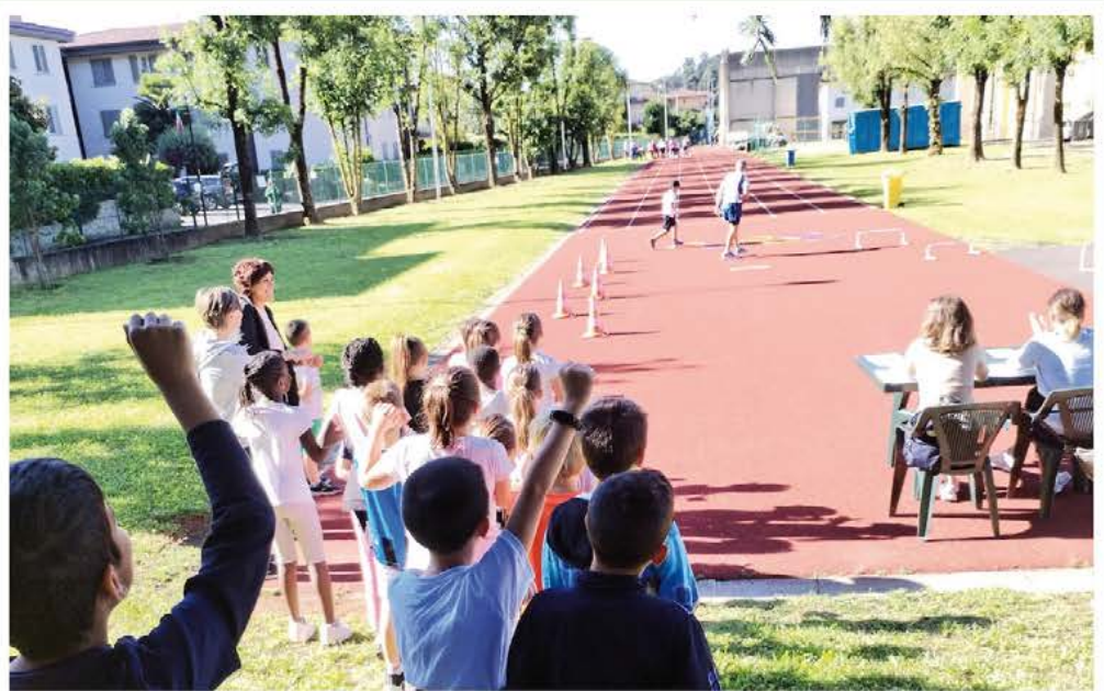
A SCUOLA DI SPORT